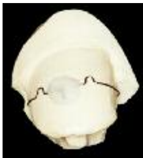
3TO-Nagelkorrekturspanne (frühere VHO-Osthold-Spanne) am Gipsmodell

Fußpflege eingeführt. Seit dem 1. Januar 2002 Vertrieb unter dem Namen 3TO-Spanne®.