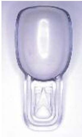
Abdrucklöffel (Fü. Erdodent)

Abduktion (latein.) abducere = wegführen f : (engl.: abduction ). Wegführen eines Glieds von der Mittellinie des Körpers, z. B. das Nachaußenheben eines Arms. Vgl.: Adduktion .