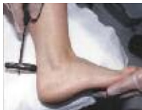
Auslösen des Achillessehnenreflexes

(engl.: Achilles tendon reflex ). Abk.: ASR . Triceps-surae-Reflex . Wird zu diagnosti-